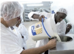
Atelier de fabrication de crèmes glacées avec fruits et lait locaux et points de distribution

formation d'environ 200 jeunes de la région Camp-Perrin à la confection d'articles textiles afin qu'ils puissent participer au financement de leur scolarité