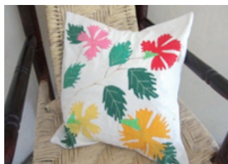
Atelier Mon Makaya

formation d'environ 200 jeunes de la région Camp-Perrin à la confection d'articles textiles afin qu'ils puissent participer au financement de leur scolarité