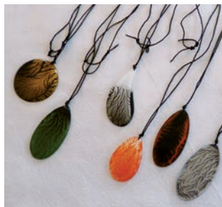
Lancement d'une coopérative de fabrication de bijoux en corne de bœuf

Sculpteur - finaliste du concours Digicel Entrepreneurs 2012