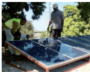
Accompagnement de l'entreprise de fabrication de panneaux solaires ENERSA pour la mise en conformité des panneaux en vue d'une certification internationale